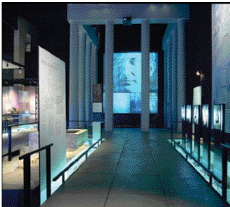
Au musée du Pont du Gard, les interventions du graphiste, Antoine Robaglia, vont de la classique mise en page des unités textuelles – en quatre langues –, à la mise au point de schémas techniques, jusqu'à des bannières et frises d'images de plusieurs mètres de long.

sommaire », la phase suivante pour les contenus est celle de la programmation détaillée. C'est là qu'est imaginé et défini précisément chaque élément du parcours. Pour un centre d'interprétation, le programme détaillé comprend, suivant les cas, les synopsis des documentaires, la sélection iconographique, les scénarios des interactifs, les principes des manips, le repérage des objets, la définition de chaque élément textuel, les descriptifs des maquettes, les descriptifs des climats ou des programmes sonores... Au musée du Pont du Gard, c'est toute une équipe menée par Lydia Elhadad qui, sous ma responsabilité, l'a effectué. Pour la scénographie et le graphisme, les phases d'étude suivantes (avant-projet détaillé et dossiers de consultation des entreprises) sont par conséquent plus lourdes. Ensuite, du côté des contenus toujours, des cahiers des charges nombreux doivent être rédigés et des consultations menées pour sélectionner les réalisateurs. Le suivi de réalisation est, après cela, une phase primordiale, puisqu'elle suppose de cheminer pas à pas auprès des réalisateurs afin de guider, corriger et mener à terme les différents artefacts, tout en laissant une grande place créative aux intervenants. Ils ont la possibilité de faire des propositions qui infléchissent les contenus et les enrichissent. Mais ils peuvent parfois avoir des difficultés à percevoir que l'élément qu'ils