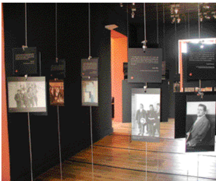
La « galerie » du musée Apollinaire donne à voir le poète par le prisme du regard de ses contemporains, en utilisant des reproductions.

La « galerie » du musée Guillaume Apollinaire. Homme aux multiples facettes, extrêmement sociable, pris dans un univers foisonnant de création artistique : je trouvais sur lui beaucoup de témoignages et de portraits, faits par ses contemporains, que ce soit par l'image ou par le texte. Nous n'avions pas ces collections de portraits, mais elles étaient accessibles. Dresser nous-mêmes un portrait de Guillaume Apollinaire