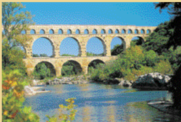
Le site du Pont du Gard