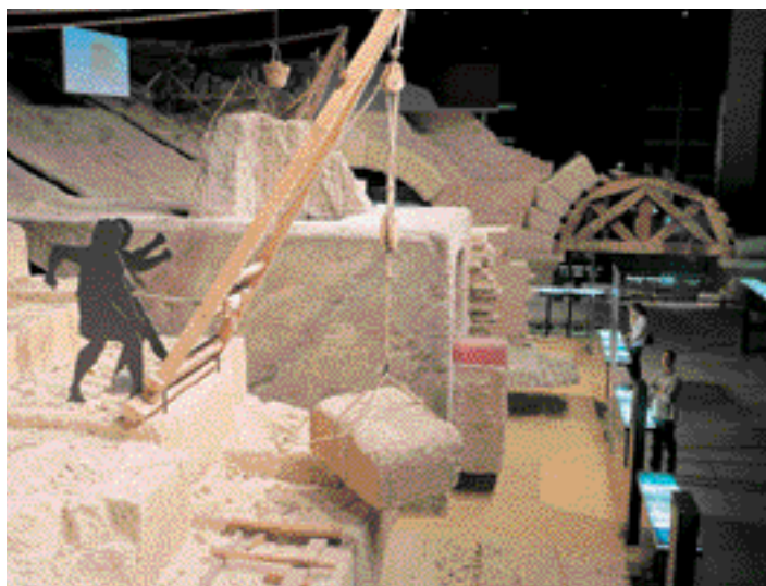
Au musée du Pont du Gard, la restitution du chantier de construction antique imaginée par les scénographes Leconte et Noïrot.

entretien avec Martine Thomas-Bourgneuf par Noémie Drouguet *