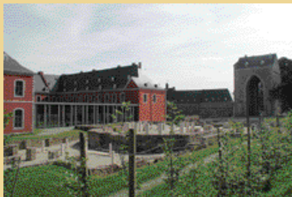
L'abbaye de Stavelot