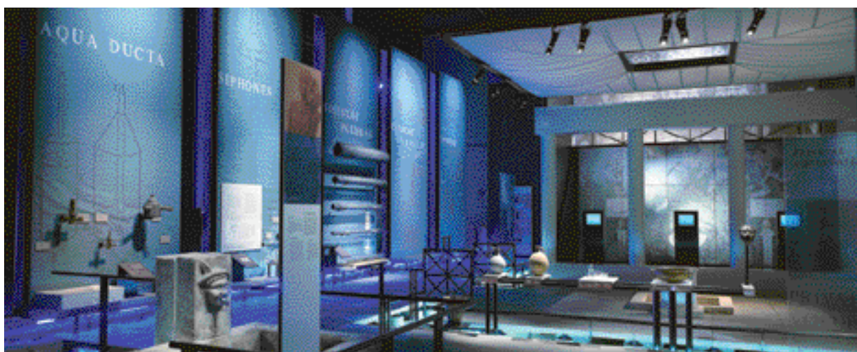
Musée du Pont du Gard, l'usage des copies : l'absence de vitrines signifie que l'objet présenté est une copie – ce qui est précisé aussi dans le cartel l'accompagnant – et permet qu'il soit touché par les visiteurs.

Pour un centre d'interprétation, la commande est en général thématique, et il faut étudier le thème de façon globale, large ; on va bien au-delà de l'analyse d'une collection. Cela représente un gros travail de documentation, d'immersion dans le sujet. Cette étude, pluridisciplinaire, a pour but de dégager l'essentiel et les singularités d'un sujet et de chercher comment le faire passer, le traduire, comment en faire la médiation. On se demande, en plus, quels sont les pré-requis culturels et les nécessités de contextualisation ou de mise en perspective qu'il suppose. Tout ceci afin de structurer